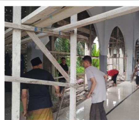
Bersih Bersih Masjid