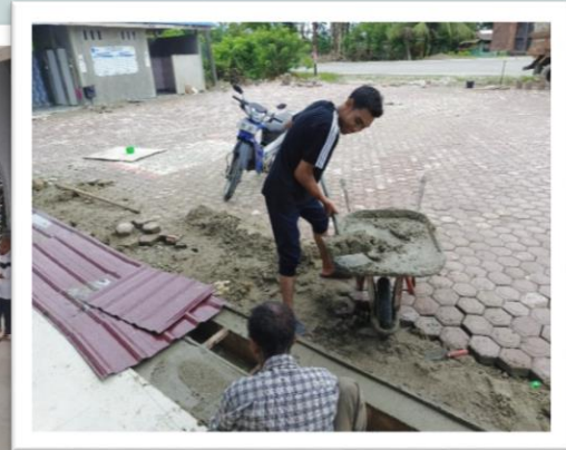
Pemasangan paving blok