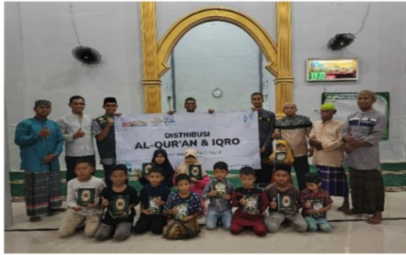
Distribusi Al-Qur'an dan Iqro'