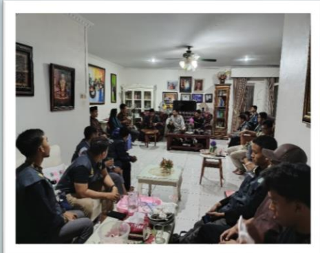
Silaturahmi keKetua Ddii Medan