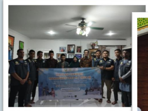
Silaturahmi keKetua Ddii Medan