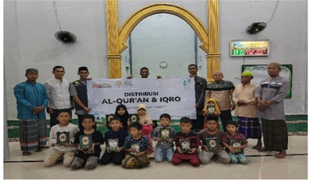
Distribusi Al-Qur'an dan Iqro'