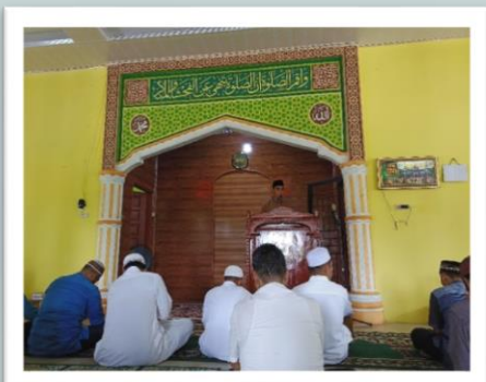
Khotbah Jum'at Masjid At-Takwa